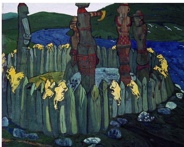
Рис. 3. Н.К. Рерих. Идолы, 1901 г. (Государственный Русский музей, Санкт-Петербург)

Отправляясь за поисками новых идей и знаниями в Европу, Н.К. Рерих знакомится с Фернан Кармоном, французским художником-реалистом, который советует молодому Рериху обратиться к «подземельным корням истории», а именно языческим мотивам. Мастер следует совету и начинает многолетнюю художественную, историческую и источниковедческую работу над картиной «Идолы» (рис. 3).