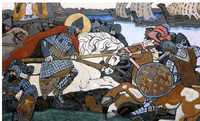
Рис. 6. Н.К. Рерих. Александр Невский поражает Ярла Биргера, 1904 г. (Государственный Русский музей, Санкт-Петербург)

Говоря о ранении Ярла Биргера копьём Александра Невского, возникает ряд вопросов (см. рис.). Один из них заключается в том, что «Житие», «Новгородская 1-я летопись» не упоминают имени Ярла Биргера. Только в Новгородской летописи конца XV – начала XVI вв. замечено имя предводителя войска (Бергель), взятое из новгородской подделки первой половины XV в. Рукописания Магнуша – представлявшей собой псевдозавещания короля Магнуса Эрикссона, в которой он убеждает не ходить войной на непобедимых новгородцев, особенно после победы Александра над шведами и упоминает «мейстера Бергера, который уже пытался противостоять Александру». Считается, что Бергель – искажённое имя крупного шведского государственного деятеля XIII века Биргера Магнуссона, основателя Стокгольма и завоевателя Финляндии. Однако, историческая истина всё же присутствует. Например, Биргер действительно воевал в Южной Финляндии, но после происшествия на Ижоре в 1249–1250 гг.