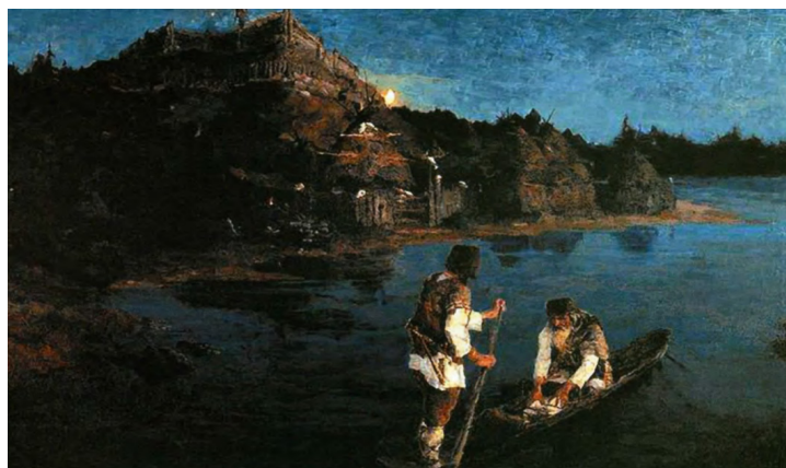
Рис. 1. Н.К. Рерих. Гонец. Восстал род на род, 1897 г. (Государственная Третьяковская галерея, Москва)

В ноябре 1897 г. Н.К. Рериху присвоили звание художника по случаю окончания Академии художеств. Его дипломная работа под названием «Гонец. Восстал род на род» (рис. 1) оправдала надежды его учителя А.И. Куинджи и художественного критика В.В. Стасова. С выставки выпускная картина художника была приобретена П.М. Третьяковым для его коллекции [2, с. 31–33].