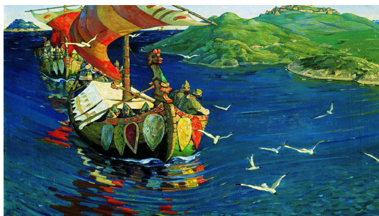
Рис. 4. Н.К. Рерих. Заморские гости, 1901 г. (Государственная Третьяковская галерея, Москва)

В 1899 г. Н.К. Рерих путешествует по «великому водному пути» к Новгороду и тогда рождается сюжет знаменитой картины «Заморские гости» (рис. 4) [2, с. 58–59].