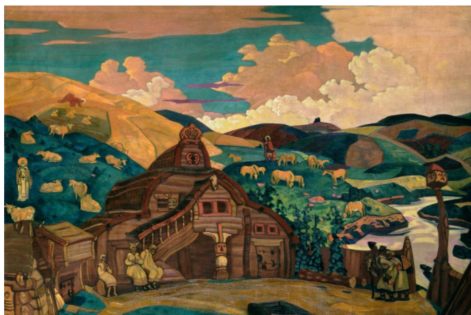
Рис. 7. Н.К. Рерих. Три радости, 1916 год (Государственный Русский музей, Санкт-Петербург)

Считается, что кульминационной картиной Славянского цикла Н.К. Рериха является картина «Три радости» (рис. 7). На первый взгляд зрителю может быть непонятна идея данного произведения, но после прочтения объяснений самого художника, идея картины становится понятной и ещё более интересной: «Хожалый гусяр повещает поселянину о трех радостях. Сам Святой Егорий коней пасет, сам Николай Чудотворец стада убережет, сам Илья Пророк рожь зажинает». На полотне изображена семья поселянина, которую окружают самые почитаемые на Руси Святые. Святой Егорий после 30 лет заточения выходит на свет для утверждения на земле христианства, Святой Николай – заступник от бед и несчастий, Илья Пророк – озаренный Богом глашатай, посылает на землю плодородие, а в центре расположен деревянный терем сливающийся, как олицетворение русской земли [9].