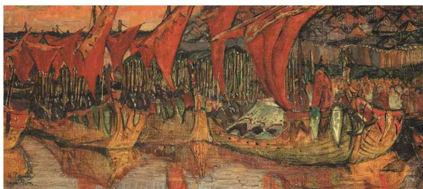
Рис. 2. Н.К. Рерих. Красные паруса. Поход Владимира на Корсунь, 1900 г. (Государственная Третьяковская галерея, Москва)

Картина, написанная в рамках Славянского цикла, в 1900 г. также переносит нас в самые ранние периоды становления нашего государства. В 988 или 989 году русский князь Владимир Святославич взял византийский город Херсонес (Корсунь), что ознаменовало Крещение Владимира и русского государства. Один из моментов этих знаменательных событий отображён в картине «Красные Паруса. Поход Владимира на Корсунь» (рис. 2).