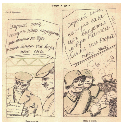
Рис. 5. Отцы и дети. А. Каневский [8]

Если предыдущий рисунок иллюстрирует передачу опыта и ответственность старшего поколения за воспитание смены, то следующий – совместные усилия отцов и детей в достижении общей цели. На рисунке А. Каневского, озаглавленном «Отцы и дети» в выпуске № 14 за июль 1941 г., представлены две части: слева изображён рабочий-отец, который читает письмо сына с передовой: «Дорогой отец, сегодня наше подразделение уничтожило на три танка больше, чем вчера. Твой сын». На заднем плане виден цех завода, что подчёркивает его принадлежность к трудовому фронту. Справа изображён солдат-сын, читающий письмо отца с завода: «Дорогой сын, сегодня наш цех выпустил на три танка больше, чем вчера. Твой отец». И на заднем плане виднеется поле боя с танками и взрывами. Подпись «Весь в отца» и «Весь в сына» подчёркивает связь между поколениями, их общее стремление превзойти результаты прошлого дня.