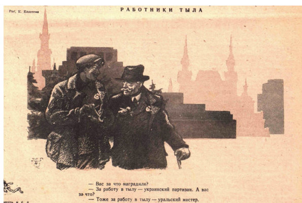
Рис. 2. Работники тыла. К. Елисеев [5]

Особое внимание на страницах журнала уделялось единству поколений, где опыт старших сочетался с энтузиазмом молодёжи. Это наглядно демонстрирует рисунок К. Клементьева «Музыкальная картинка» в мартовском выпуске № 11 1942 г., изображающий символическую передачу ответственности и общей цели. На рисунке изображена крупнокалиберная артиллерия. Надпись под рисунком гласит: «Спасибо, товарищи бойцы, за прекрасную музыку! А вам, товарищи рабочие, — за отличные инструменты!» (рис. 3). Артиллерия показана как музыкальный инструмент, создающий «музыку» победы. Солдат и рабочий пожимают руки, что символизирует взаимное уважение и благодарность. Художник с помощью простых линий и символизма передает идею важности каждого участника войны: оружие, созданное трудом рабочих, служит делу победы.