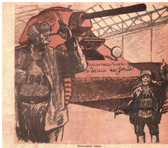
Рис. 4. Новогодняя смена. К. Елисеев [7]

и дальше на Запад!» подчеркивает связь трудового фронта с осуществившимися военными победами, символизируя поддержку фронта заводами, производящими военную технику. Надпись под рисунком «Новогодняя смена» намекает на то, что трудовой подвиг продолжался даже в праздничные дни, а преемственность поколений и готовность работать ради Победы стала центральной идеей.