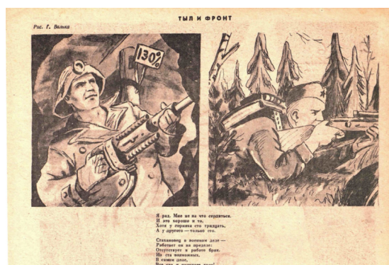
Рис. 1. Тыл и фронт. Г. Вальк [4]

«Я рад. Мне не на что сердиться. И это хорошо и то, Хотя у горняка сто тридцать, А у другого – только сто. Стахановец в военном деле – Работает он на пределе: Отсутствует в работе брак. Из ста возможных, В самом доле, Все сто и получает враг!»