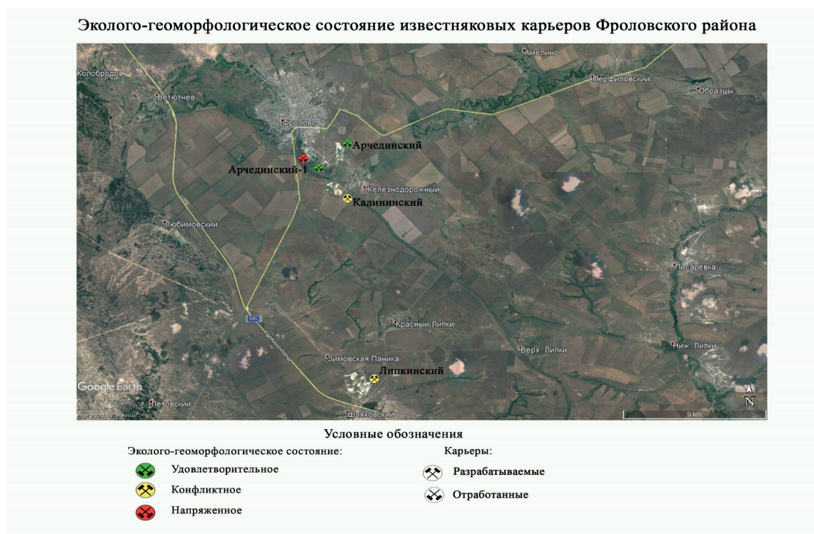
Рис. 2. Картограмма «Эколого-геоморфологическое состояние известняковых карьеров Фроловского района»

Для известняковых карьеров на стадии разработки экскаваторным и буровзрывным способом характерны обвально-осыпные процессы и дефляция карбонатной пыли. После окончания активной эксплуатации при значительном обводнении в днище образуется водоем, в бортах карьерных выемок получают развитие карстовые процессы с образованием форм карстового микрорельефа.