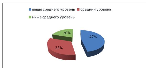
Рис. 1. Результаты частотного анализа представленности уровней объема внимания в выборке второклассников

В целях выявления различий в развитии свойств внимания (устойчивости и объема) второклассников было проведено исследование на базе МКОУ «Эльтонская сош» поселка Эльтон Палласовского района Волгоградской области. В нем приняли участие 15 учащихся 2-го класса.