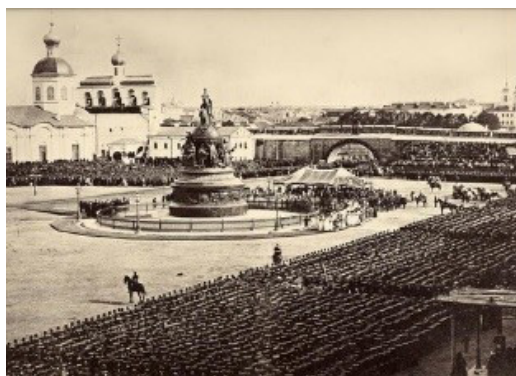
Рис. 5. В. Ильмар «Открытие памятника “Тысячелетие России”» [5]

Вторая группа анализируемых фотодокументов является небольшой по количеству снимков (8 фото), но достаточно информативной в плане оценки создания культурно-исторических образцов. Фотографии, зафиксировавшие монумент Петру I, памятник Николаю I, памятник св. Владимиру, памятник К. Минину и Д. Пожарскому, памятник царю Михаилу Федоровичу и Ивану Сусанину позволяют судить о наличии в России в период реформ Александра II культурного наследия и исторической памяти. Кульминационным в данном ряду является снимок открытия памятника «Тысячелетие России» (рис. 5).