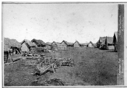
Рис. 8. В. Каррик «Село Башкондино»

Четвертая группа фотодокументов была выделена на основе анализа 37 снимков, отражающих повседневную жизнь различных слоев населения. Анализ серии В. Каррика «Русские типы» дает представление о расслоении крестьянской среды, из которой стали выделяться различные типы городских торговцев, ремесленников и рабочих: извозчик, кирпичник, мясник, галантерейщик, официант, торговцы корзинами, пирогами, квасом и др. Кадры данного типа дают информацию и о разном материальном положении социальных групп российского общества второй половины XIX в. (рис. 8–9 на с. 40).