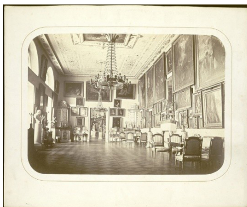
Рис. 9. Дворец князей Юсуповых на Мойке

Реформирование заложило основы освобождения крестьянства от системы личной и имущественной зависимости, но в XIX в. положение разночинцев, вышедших из крестьянской среды, не сильно улучшилось. Личная свобода позволяла занять другую профессиональную нишу, а тяжелые условия труда и откупа оставляли большую часть населения на грани выживания.