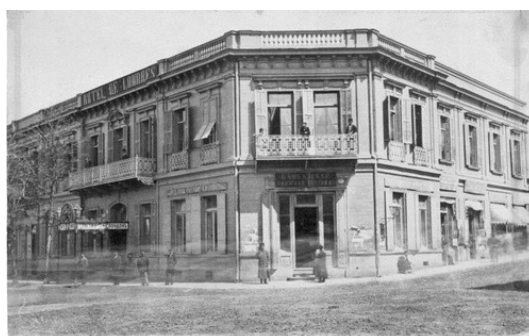
Рис. 7. Гостиница «Лондон» [3]

Развитие капиталистических отношений дало толчок в финансировании строительства железных дорог как со стороны государства, так и со стороны предпринимателей России и зарубежья. Пути сообщения способствуют повышению мобильности общества и необходимость строительства гостевых домов. Это подтверждает запечатленная на снимке гостиница «Лондон» (рис. 7).