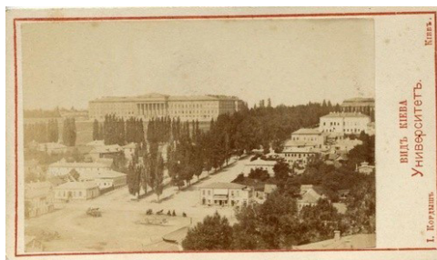
Рис. 1. И. Кордыш «Киевский Императорский университет святого Владимира» [8]

Среди изучаемых кадров есть работа, взятая из Мультимедиа Арт музея Москвы. Первоначально названия снимок не имеет, создатели интерпретировали здание на заднем плане как Императорский университет св. Владимира (ныне Киевский национальный университет им. Тараса Шевченко) (рис. 1).