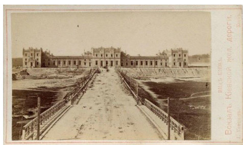
Рис. 6. И. Кордыш «Вокзал Киевской железной дороги» [7]

Развитие капиталистических отношений дало толчок в финансировании строительства железных дорог как со стороны государства, так и со стороны предпринимателей России и зарубежья. Пути сообщения способствуют повышению мобильности общества и необходимость строительства гостевых домов. Это подтверждает запечатленная на снимке гостиница «Лондон» (рис. 7).