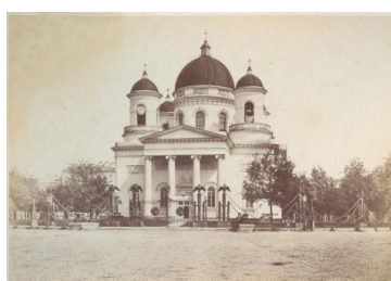
Рис. 3. Bureau F. «Воспоминания о Москве» Собор Василия Блаженного [1]