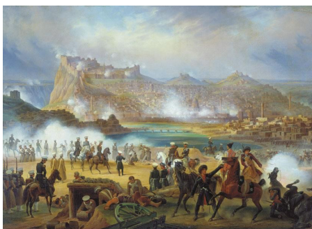
Рис. 5. Я. Суходольский «Штурм крепости Карс 27 июня 1828 года»

Одним из самых ярких художников-баталистов XIX в. является Франц Алексеевич Рубо (1856–1928). Художник был наиболее видной фигурой в русской батальной живописи конца XIX – начала XX вв. Его произведения являются ценным вкладом в батальную живопись, а педагогическая деятельность Рубо во главе батальной мастерской стала основой для целого ряда русских, а затем и советских мастеров-баталистов [14, 27]. Он наиболее всего известен созданием батальных панорам «Оборона Севастополя», «Бородинская битва» и «Штурм аула Ахульго». Также он руководил батальной мастерской Академии художеств. Полотно «Сражение под Елисаветполем 13 сен-