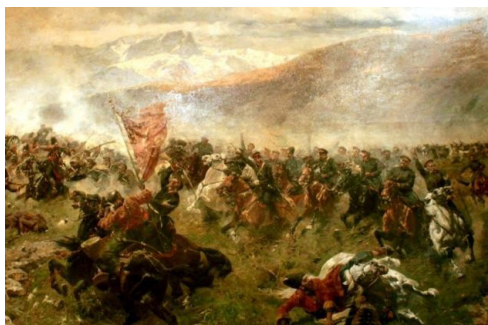
Рис. 6. Ф.А. Рубо «Сражение под Елисаветполем 13 сентября 1826 года»

тября 1826 года» (рис. 6) [21] отражает главное сражение русско-персидской войны 1826–1828 гг., ставшее переломным. Картина хранится в Музее истории Азербайджана.