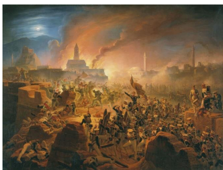
Рис. 4. Я. Суходольский «Штурм крепости Ахалцих 15 августа 1828 года»

Эти события не остались без внимания художников-баталистов. Штурму Ахалциха посвящена работа варшавского художника Януария Суходольского (1797–1875) «Штурм крепости Ахалцих 15 августа 1828 года» (рис. 4) [25]. Полотно было написано в 1839 г. Тогда же художник получил звание академика Императорской Академии художеств за ее написание [15, с. 192]. В этот же год им было создано ещё одно полотно, отражающее события русско-турецкой войны 1828–1829 гг. – «Штурм крепости Карс 27 июня 1828 г.» (1839) (рис. 5.) [26]. Картины хранятся в Военно-историческом музее артиллерии, инженерных войск и войск связи в Санкт-Петербурге.