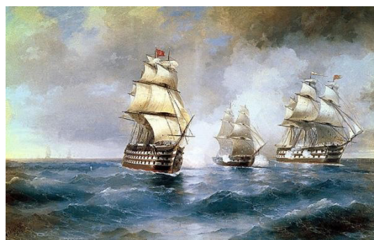
Рис. 1. И.К. Айвазовский «Бриг “Меркурий”, атакованный двумя турецкими кораблями»

Художник нарисовал две картины, посвященные событиям русско-турецкой войны 1828–1829 гг. – «Бриг “Меркурий”, атакованный двумя турецкими кораблями» (1892) (рис. 1) [1] и «Бриг “Меркурий” после победы над турецкими кораблями идет навстречу русской эскадре» (1848) (рис. 2 на с. 70) [2].