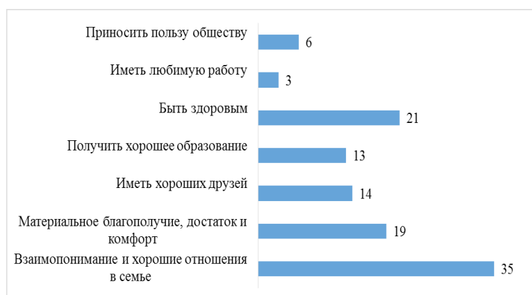
Рис. 1. Каковы Ваши жизненные цели?

Главными жизненными целями подростки считают взаимопонимание в семье и хорошие отношения со своей семьей (см. рис. 1). Подростки испытывают острую потребность в семье, для них она играет первостепенную роль. Ее возводят на пьедестал и ради нее могут пожертвовать чем угодно – как низкими ценностями (материальные блага, деньги), так и высокими (общественный долг, интересы большинства людей). В семье ребенок находит поддержку и внимание, помощь и ответы на многочисленные вопросы. Семья определяет, каким подросток вступит во взрослую жизнь, формирует характер ребенка, развивает его социальные качества. Чаще всего ребенок несознательно копирует поведение родителей. Они своим примером приобщают детей к нравственным ценностям.