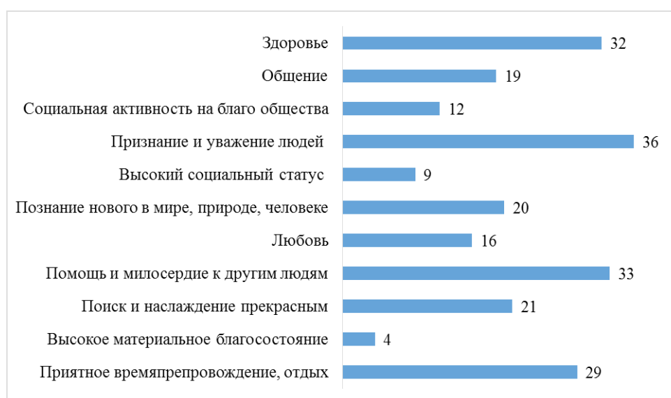
Рис. 6. Что для современных подростков является важным в жизни?

В структуре ценностей были выявлены следующие закономерности: более значимыми для подростков являются признание и уважение, помощь и милосердие, здоровье и приятное времяпровождение (см. рис. 6). Ребята считают эти ценности фундаментом их будущей жизни. Ценности самоутверждения оказались значимыми для 95% опрошенных. Действительно, всякому человеку свойственна потребность быть успешным в своих глазах и во мнении окружающих. Однако в особой мере это характерно для подростка, с его обостренным чувством собственного достоинства. Наименее важными для подростков оказались такие ценности, как социальная активность ради улучшения общества и счастья других. В силу своего обывательского сознания ребята не понимают, что жить только для себя – это эгоизм, что делать другого человека счастливым, служить на благо народа может быть гораздо важнее собственного благополучия.