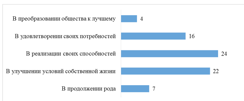
Рис. 3. В чем заключается смысл жизни?

Для большинства подростков смысл жизни заключается в реализации своих способностей, улучшении условий своей жизни, удовлетворении своих потребностей (см. рис. 3). Ключевое слово здесь – своих, а значит, индивидуалистических, эгоистических. Только 4 человека (10% опрошенных) назвали смыслом своей жизни преобразование общества к лучшему. Мы видим, что молодёжь в большинстве своём показывает безразличие к активной преобразующей деятельности, она ориентирована на потребительство и личную обеспеченность материальными и духовными благами. Общество, в котором господствует конкуренция и желание одних возвыситься над другими, в котором человек для выживания в современном мире может рассчитывать, в основном, только на себя или свою семью, т. к. при капитализме никто никому не нужен и не должен, обуславливает тот факт, что большинство старших подростков в выборе идеала останавливается на собственной личности.