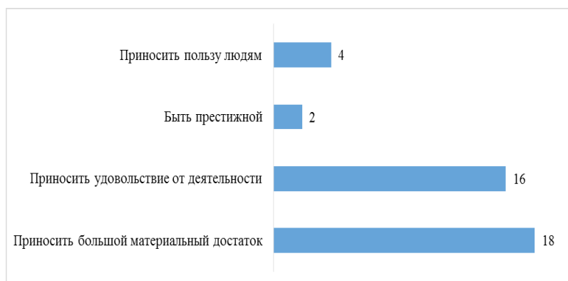
Рис. 5. Какой должна быть Ваша будущая профессия?

Что ожидают школьники от профессии? При выборе профессии школьники будут ориентироваться, прежде всего, на ту, которая принесет доход и удовольствие от деятельности (см. рис. 5). Только 10% респондентов считают, что выбранная профессия должна приносить пользу людям.