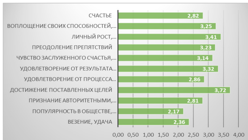
Рис. 1. Значимость характеристик понятия «успех» для подростков

Наше исследование направлено на изучение особенностей формирования образа успешного человека в подростковом возрасте. В исследовании приняли участие 50 человек (23 юноши и 27 девушек) в возрасте 15–17 лет (средний возраст – 16 лет), ученики 10-х классов (25 человек) и 11-х классов (25 человек), учащиеся ГБОУ «Волгоградский лицей-интернат «Лидер». При проведении исследования использовались следующие методики: опросник «Представления об успехе подростков» (ПУП) [1]; опросник с незаконченными предложениями «Я добился успеха в ...» [5]. Результаты исследования «Представления об успехе подростков» отражены на рис. 1.