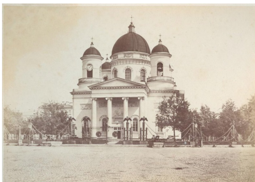
Рис. 1. Лоренс А. Спасо-Преображенский собор [7]

площадки позволили найти более 60 веб-репродукций, на которых запечатлены соборы, церкви, монастыри и храмы. Благодаря им можно визуализировать сложившееся разнообразие архитектурных стилей, которые образуют единый «русский стиль»: русско-византийский (рис. 1), допетровский (рис. 2), неорусский (рис. 3).