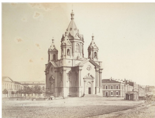
Рис. 3. Лоренс А. Благовещенская церковь Конногвардейского полка [6]