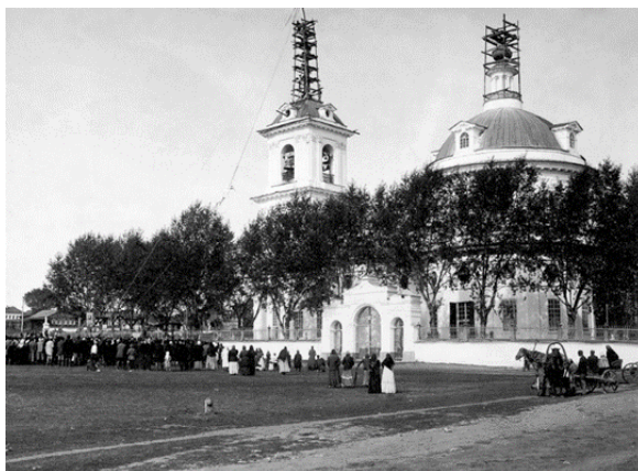
Рис. 5. Подъем креста на Спасо-Преображенскую церковь [11]

Не менее важным является общенародное участие в строительстве и открытии культовых сооружений, предназначенное для совершения богослужений и религиозных обрядов (рис. 5), (рис. 6 на с. 122). Данное положение позволяет утверждать о широком признании населением идеи народности и православия.