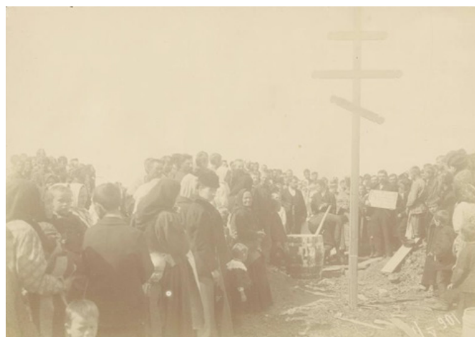
Рис. 6. Закладка строительства храма. 1901 г. [4]

3. Визуальные источники позволяют судить о двойственном процессе духовного развития общества России. Становление новаторских идей шло в неразрывной связи с идеями православия, народности и самодержавия.