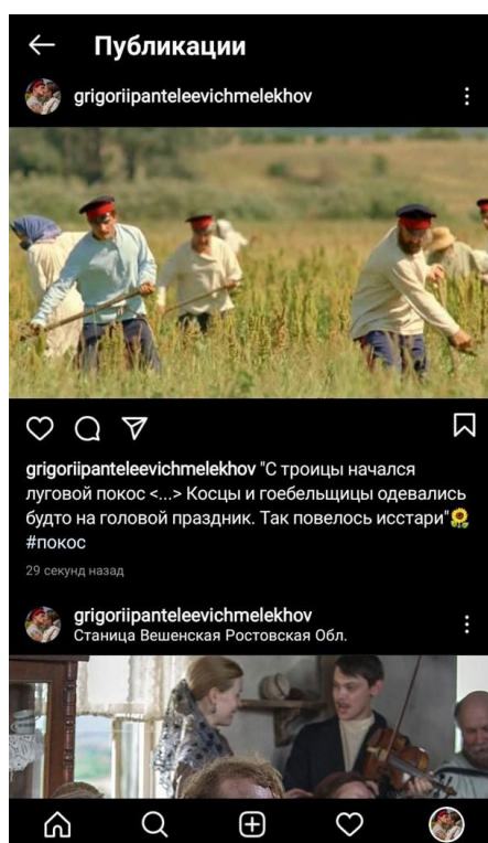
Рис. 2. Лента Григория Мелухова в Instagram