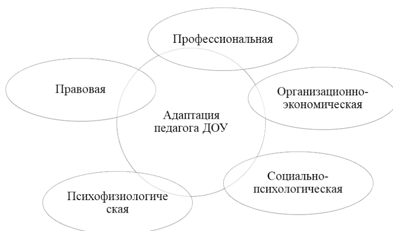
Рис. 1. Виды адаптации молодого педагога в дошкольной образовательной организации [2]

Психологическая помощь в освоении профессиональной роли воспитателя должна учитывать многообразные аспекты и специфические черты трудовой деятельности, автономного смыслообразования позиции начинающего педагога ДООУ. А.Г. Мороз выделяет следующие направления адаптации молодого педагога в условиях дошкольного учреждения (рис. 1):