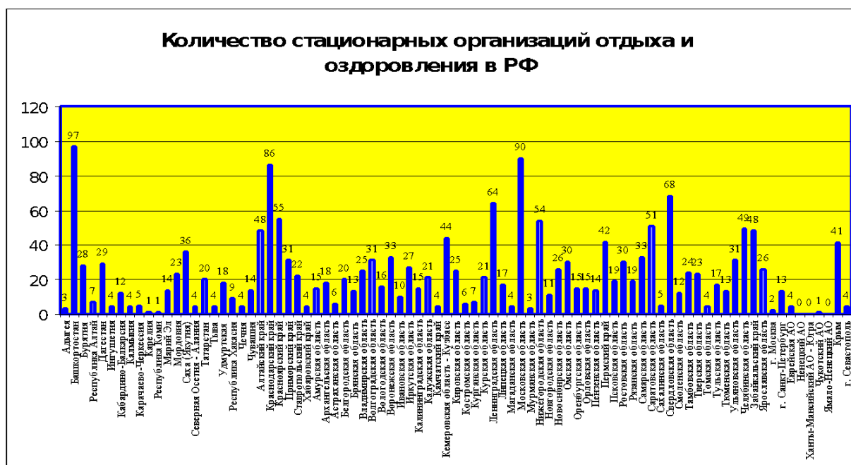
Рис. 1. Количество стационарных организаций отдыха и оздоровления в РФ

По результатам данных столбчатой диаграммы (см. рис. 1) мы видим, что в субъектах РФ число организаций не одинаково. Больше количество стационарных организаций находится в Московской области – 90, Краснодарском крае – 86, республике Башкирия – 97 (в республике Башкирия загородные оздоровительные лагеря и лагеря санаторного типа не разделяет, в этой связи цифра относительно завышена, и Башкортостан вошел в тройку лидеров).