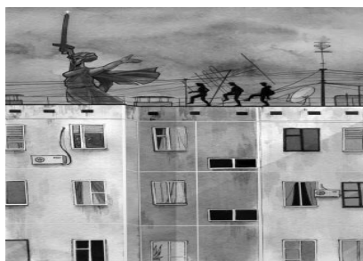
Рис. 13. Мамаев Курган, 2021 г. Циганкова Анна