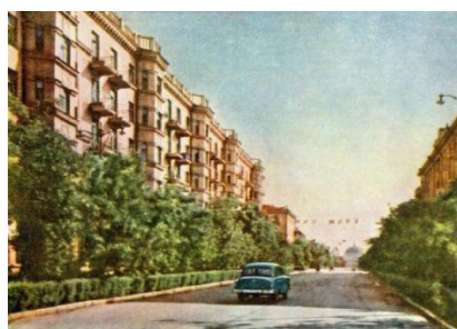
Рис. 4. Улица мира, 1960 г. [7]

В период «оттепели» в определенной степени было ослаблено идеологическое давление на литературу и искусство со стороны партийно-государственных структур. После XX съезда партии, на котором Н.С. Хрущев выступил с критикой культа личности, почтовые открытки с изображением монументальных скульптур И.В. Сталина не печатаются. Примечательным является появление серии цветных почтовых карточек, что делает их более привлекательными, а объекты реалистичнее (рис. 4, рис. 5 на с 157).