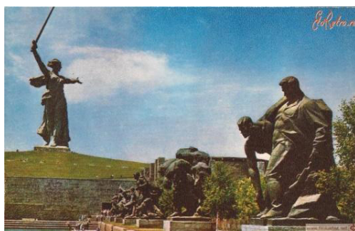
Рис. 6. Площадь Героев, 1970 г. [1]

С сер. 1960-х – 1970-е гг. акцентируется внимание на сохранение памяти о Великой Отечественной войне. В 1965 г., в честь двадцатилетнего юбилея победы советских войск, день 9 мая был признан общенародным праздником. С этого времени юридически оформлен статус «ветеран», тиражируется большое количество открыток с памятными объектами городов. Одним из главных объектов на почтовых карточках Волгограда становится Мамаев Курган, как символ города-героя, города-памятника (рис. 6, 7). Всё также остается на открытке вид площади им. В.И. Ленина, но уже с изменением ракурса и приданием цвета. Здесь уже появляется и изображение памятника идеологу советской власти В.И. Ленину (рис. 8 на с. 158). Это говорит о существовании в данный период двух уровней культурной жизни: официально-советский (действие в рамках существующей идеологии) и демократический (часто подвергался партийной критике).