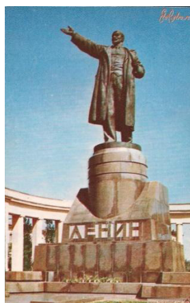
Рис. 8. Памятник В.И. Ленину, 1970 г. [1]

В 1980-е гг. происходит новый виток «оттепели» в духовной и культурной жизни советского общества, связанной с политикой «гласности». Именно поэтому активное тиражирование почтовых карточек с видом городов и местностей приходится на 80-е гг. XX в. Большинство комплектов сюжетных открыток с видами и достопримечательностями города было выпущено к 1989 г. в честь 400-летнего юбилея Царицына/Сталинграда/Волгограда (рис. 9, рис. 10, рис. 11 на с. 159). В одном из таких комплектов из 18 сюжетов 10 позиционируют Волгоград как город-герой и город-памятник. Очевидно, рассмотренные периоды имеют свои особенности, но общим в открытке остается одно – отражение развития советского государства в накопленном визуальном наследии.