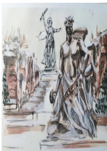
Рис. 12. Мамаев Курган, 2021 г. Даулеткалиева Алина

Считаем целесообразным на фоне советских карточек рассмотреть новые художественные образцы с сюжетами Волгограда от современных авторов. Они выполнены в достаточно интересной стилистике и очень явно отражают неподдельный интерес к историческим памятным местам (в данном случае – Мамаев Курган) славного города (рис. 12). Рис. 13 символизирует главную высоту России, которая возвышается над городом-героем и облик ей виднеется отовсюду.