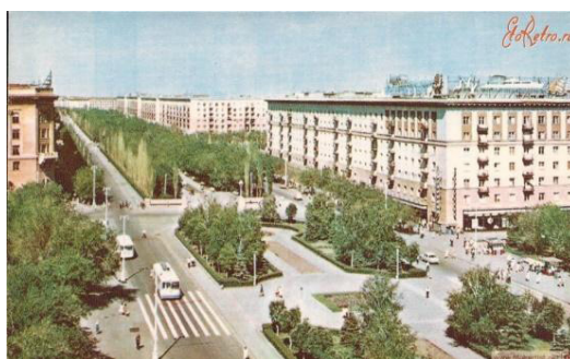
Рис. 7. Проспект им. В.И. Ленина, 1970 г. [Там же]