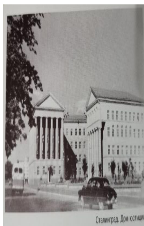
Рис. 3. Сталинград. Дом юстиции, 1954 г. [Там же]

В период «оттепели» в определенной степени было ослаблено идеологическое давление на литературу и искусство со стороны партийно-государственных структур. После XX съезда партии, на котором Н.С. Хрущев выступил с критикой культа личности, почтовые открытки с изображением монументальных скульптур И.В. Сталина не печатаются. Примечательным является появление серии цветных почтовых карточек, что делает их более привлекательными, а объекты реалистичнее (рис. 4, рис. 5 на с 157).