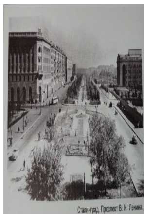
Рис. 2. Сталинград. Проспект В.И. Ленина, 1954 г. [6]