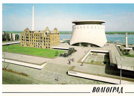
Рис. 10. Музей-панорама «Сталинградская битва», 1969 г. [Там же]