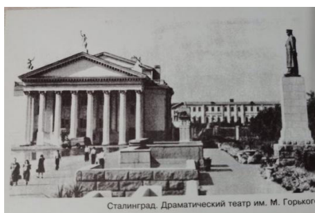
Рис. 1. Сталинград. Драматический театр им. М. Горького, 1954 г. [6]

Одна из особенностей изучения почтовых карточек заключается в «транслировании» идеологических и социокультурных установок советской власти через государственный заказ. Для каждого исторического периода, при каждом руководителе эти установки корректировались, а значит, видоизменялась и открытка, её ракурсы и объекты. Для начала 1950-х сохранялась тотальная цензура за литературным и художественным содержанием печатных изданий. В 1954 г. был выпущен блок открыток «Сталинград», состоящий из 16 различных сюжетов города, три из которых очень четко отражают деятельность советской власти. Рядом с драматическим театром стоит памятник руководителю СССР (см. рис. 1), одна из первых открыток в альбоме посвящена проспекту им. В.И. Ленина, как вождю советского государства (рис. 2 на с. 156), и на последней карточке изображен дом юстиции как символ централизованного государства (рис. 3 на с. 156).