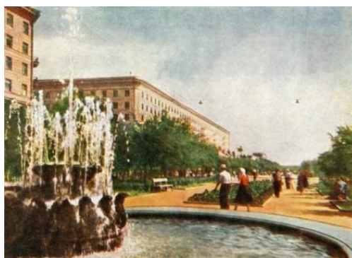
Рис. 5. Проспект Ленина, 1960 г. [7]

С сер. 1960-х – 1970-е гг. акцентируется внимание на сохранение памяти о Великой Отечественной войне. В 1965 г., в честь двадцатилетнего юбилея победы советских войск, день 9 мая был признан общенародным праздником. С этого времени юридически оформлен статус «ветеран», тиражируется большое количество открыток с памятными объектами городов. Одним из главных объектов на почтовых карточках Волгограда становится Мамаев Курган, как символ города-героя, города-памятника (рис. 6, 7). Всё также остается на открытке вид площади им. В.И. Ленина, но уже с изменением ракурса и приданием цвета. Здесь уже появляется и изображение памятника идеологу советской власти В.И. Ленину (рис. 8 на с. 158). Это говорит о существовании в данный период двух уровней культурной жизни: официально-советский (действие в рамках существующей идеологии) и демократический (часто подвергался партийной критике).