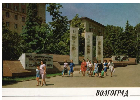
Рис. 9. Мемориальный комплекс на аллее Героев», 1969 г. [2]

В 1980-е гг. происходит новый виток «оттепели» в духовной и культурной жизни советского общества, связанной с политикой «гласности». Именно поэтому активное тиражирование почтовых карточек с видом городов и местностей приходится на 80-е гг. XX в. Большинство комплектов сюжетных открыток с видами и достопримечательностями города было выпущено к 1989 г. в честь 400-летнего юбилея Царицына/Сталинграда/Волгограда (рис. 9, рис. 10, рис. 11 на с. 159). В одном из таких комплектов из 18 сюжетов 10 позиционируют Волгоград как город-герой и город-памятник. Очевидно, рассмотренные периоды имеют свои особенности, но общим в открытке остается одно – отражение развития советского государства в накопленном визуальном наследии.