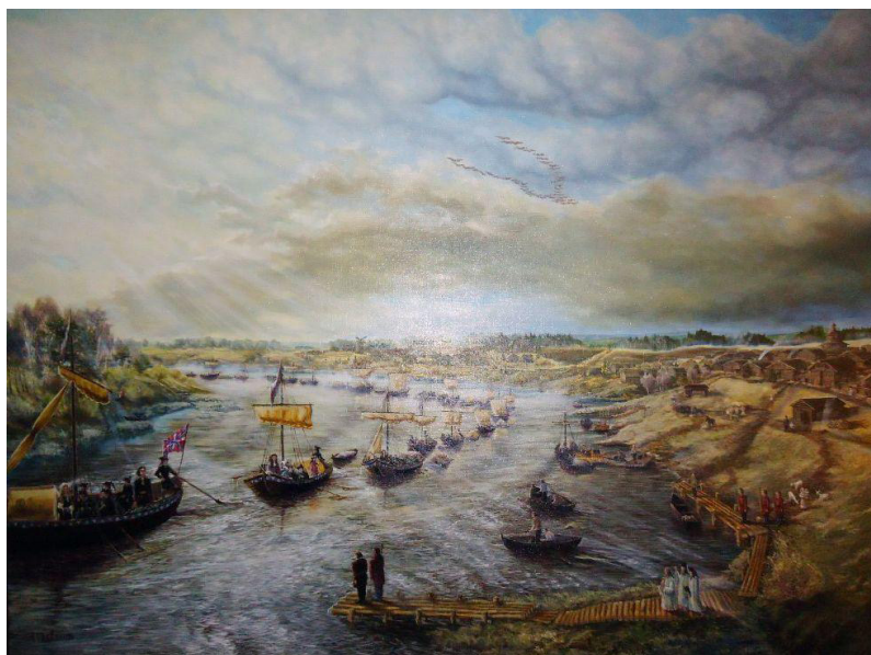
Рис. 9. М. Ильин. «Петр I на пути в Архангельск. Город Тотьма». 2017 г.

Из стран Западной Европы активное сотрудничество в сфере торговли ещё со Ивана Грозного проявляла только Англия (через Архангельск) (см. рис. 9).