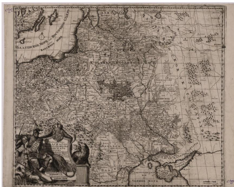
Рис. 2. П. Пикарт, А. Шхонебек. «Каролества Полскаго и Великаго Княжества Литовскаго чертеж». 1705 г.

Подчеркнем, все эти страны обладали достаточной большой армией, сильной экономикой и огромными территориями, а поэтому являлись потенциальными соперниками Российского государства. «Великое посольство», предпринятое Петром Алексеевичем в 1697–1698 гг. (см. рис. 3), имело ряд задач, в том числе – добиться продолжения войны с Османской империей и привлечь новых союзников [5, с. 267].