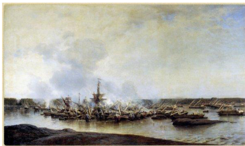
Рис. 8. А. Боголюбов. «Сражение при Гангуте 27 июля 1714 года». 1877 г. Центральный военно-морской музей им. Императора Петра Великого. СПб.