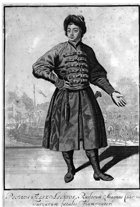
Рис. 3. «Петр I на фоне торжественного приема Великого Посольства в Амстердаме». Гравюра неизвестного художника. 1710–1720-е гг.

Подчеркнем, все эти страны обладали достаточной большой армией, сильной экономикой и огромными территориями, а поэтому являлись потенциальными соперниками Российского государства. «Великое посольство», предпринятое Петром Алексеевичем в 1697–1698 гг. (см. рис. 3), имело ряд задач, в том числе – добиться продолжения войны с Османской империей и привлечь новых союзников [5, с. 267].