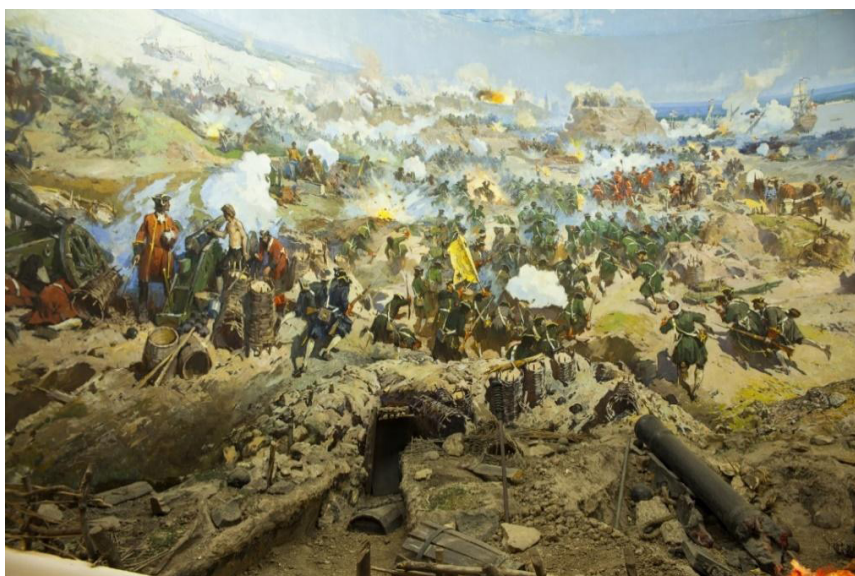
Рис. 5. А. Чернышов. Фрагмент диорамы «Взятие русскими войсками Азова 18 июля 1696 г.». 1968 г. Азовский музей-заповедник

По результатам Второго Азовского похода 1696 г. Россия получила крепость Азов (см. рис. 5), что было закреплено Константинопольским миром [3, с. 11], однако пока Керченский пролив был в руках турок, это еще не давало ей доступа в Черное море.