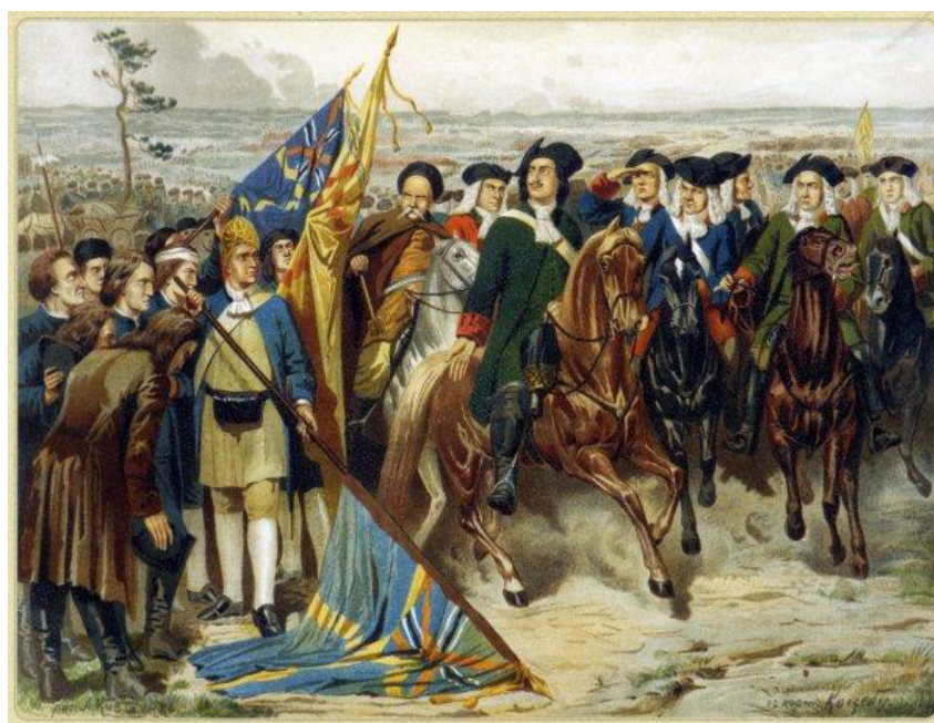
Рис. 7. А. Кившенко. «Полтавский бой. Шведы преклоняют знамёна перед Петром I. 1709 год». 1880 г. Военно-исторический музей артиллерии, инженерных войск и войск связи. СПб.

Более успешна в этом плане была Северная война 1700–1721 гг. (см. рис. 7, 8 на с. 99), т. к. в итоге Российская империя получила Прибалтику – с одной стороны, как военно-морскую базу, с другой – как международную торговую точку, что расширяло сферу влияния России.