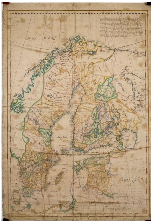
Рис. 1. К. Грипенхильм. Карта Швеции. 1688 г.

Воспользуемся общепринятой после распада СССР классификацией деления стран на «ближнее» и «дальнее» зарубежье. Собственно, разница заключается в общей границе с государством. На момент начала правления Петра Первого такими странами являлись Швеция (см. рис. 1), Речь Посполитая (Польша) (см. рис. 2 на с. 96), Османская Империя и подконтрольное ей Крымское ханство.