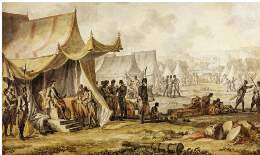
Рис. 6. М.М. Иванов. «Петр I на реке Пруте». 1804 г. ГТГ, Москва

Однако в 1711 г. после Прутского похода (см. рис. 6) Азов был утерян, юридически это было зафиксировано в Адрианопольском мирном договоре 1713 г. [3, с. 11].