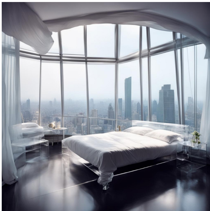
Рис. 3. Комната Д-503. Изображение сгенерировано нейросетью Кандинский 3.0 [8]

ражаемый в виде белой плоскости, трансформировался в горизонтально натянутую штору, что в большей степени соответствует тексту произведения (см. рис. 3).