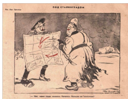
Рис. 3. Под Сталинградом. Б. Ефимов [3]

Калач-на-Дону стал ключевой точкой, через которую немецкие войска рассчитывали обеспечить снабжение своих передовых частей, но вместо этого столкнулись с ожесточённым сопротивлением советских сил. Карикатура Б. Ефимова с иронией подчёркивает, что эта попытка обернулась для противника провалом, оставив у него горькие воспоминания о месте, ставшем символом решимости и стойкости.