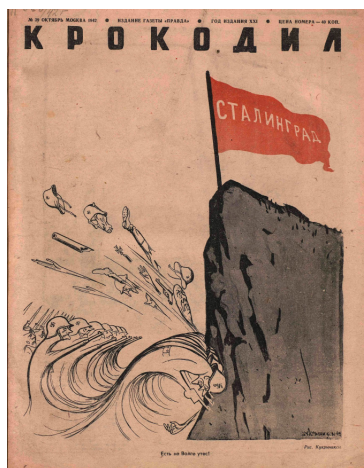
Рис. 1. Есть на Волге утес! Кукрыниксы [11]

включая простых жителей, рабочих и солдат, уже стал символом несгибаемой воли и стойкости советского народа перед лицом врага. Однако сильными сторонами противника в Сталинграде помимо численного превосходства в живой силе и технике, были подавляющее господство в воздухе, умелое использование танковых соединений и хорошо налаженная связь [8]. Однако все это оказалось бес- сильным перед «Сталинградским утёсом», который встречается нам на обложке журнала № 39 в октяб- ре 1942 г. (см. рис. 1).