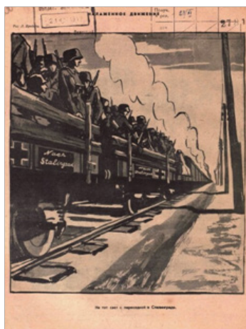
Рис. 2. Налаженное движение. Л. Бродаты [2]

Также в другом ноябрьском выпуске № 44 1942 г. был опубликован рисунок Бориса Ефимова «Под Сталинградом» (см. рис. 3). Подпись к нему гласит: «Нет, меня сюда никаким Калачом больше не заманишь!», где речь идёт о городе Калач-на-Дону, позднее удостоенный звания Город воинской славы. Он сыграл важную роль в обороне, став мощным препятствием на пути немецкого наступления, сорвав планы захвата переправ через Дон. 6-я армия Паулюса, которая в то время почти не встречала сопротивления, вскоре увязла в ожесточенных боях под городом Калачом [8].