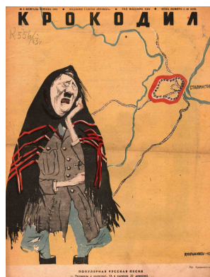
Рис. 5. Популярная русская песня. Кукрыниксы [5]

Внутри «колечка» можно заметить 22 знака свастики, каждый из которых олицетворяет одну из 22 дивизий врага, окруженных и уничтоженных советскими войсками в ходе этой битвы. Для германского командования операция «Кольцо» стала сокрушительным ударом по репутации и боеспособности немецкой армии.